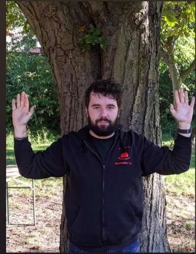
(mit winkenden Händen)